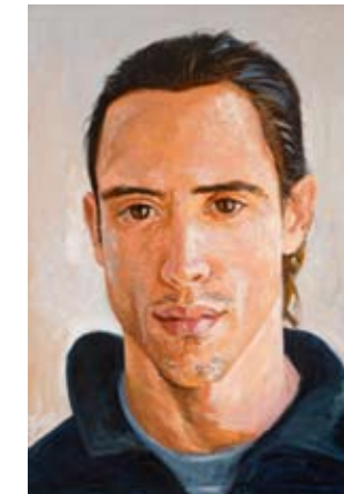
"Joan Vicenç" oli 100 x 149 cm.