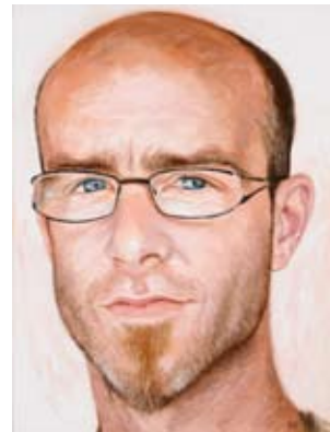
"Sasha" oli 97 x 130 cm.