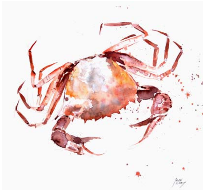
“Cranc” aquarel·la 34 x 32 cm.