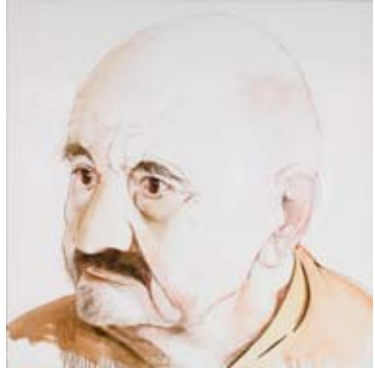
"Sebastià" dibuix a l'oli 120 x 120 cm.