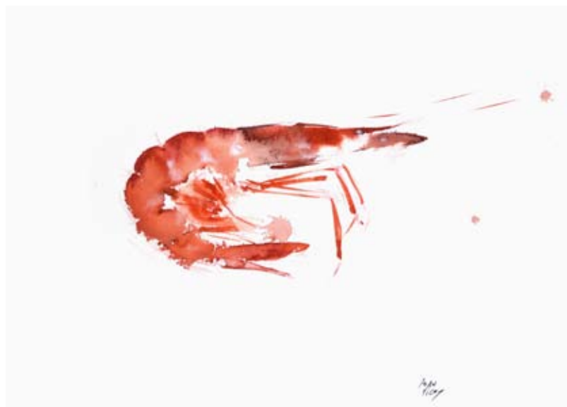
“Gamba” aquarel·la 35x 25 cm.