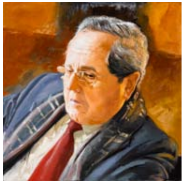
"Pep Bauzá" oli 80 x 80 cm.