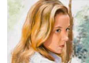
"Raquel" oli 130 x 97 cm.