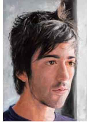
"Carlos" oli 81 x 116 cm.