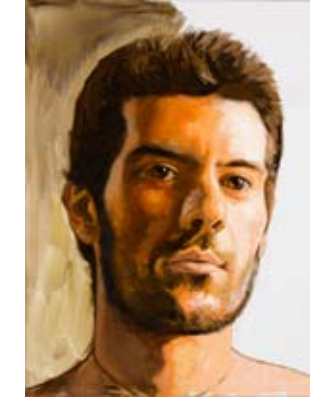
"Toni" oli 97 x 130 cm.