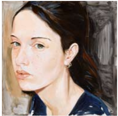
"Alexandra" oli 80 x 80 cm.