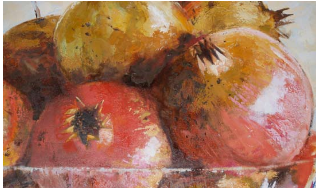
“Magranes” oli 100 x 100 cm.